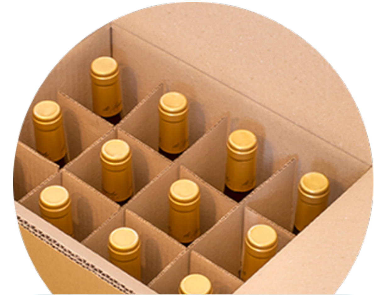
Imballaggio interno ondulato con scatola esterna in cartone ondulato