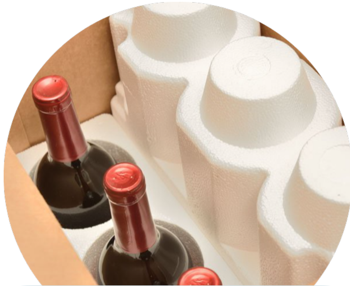
Imballaggio interno in polistirene con scatola esterna in cartone ondulato