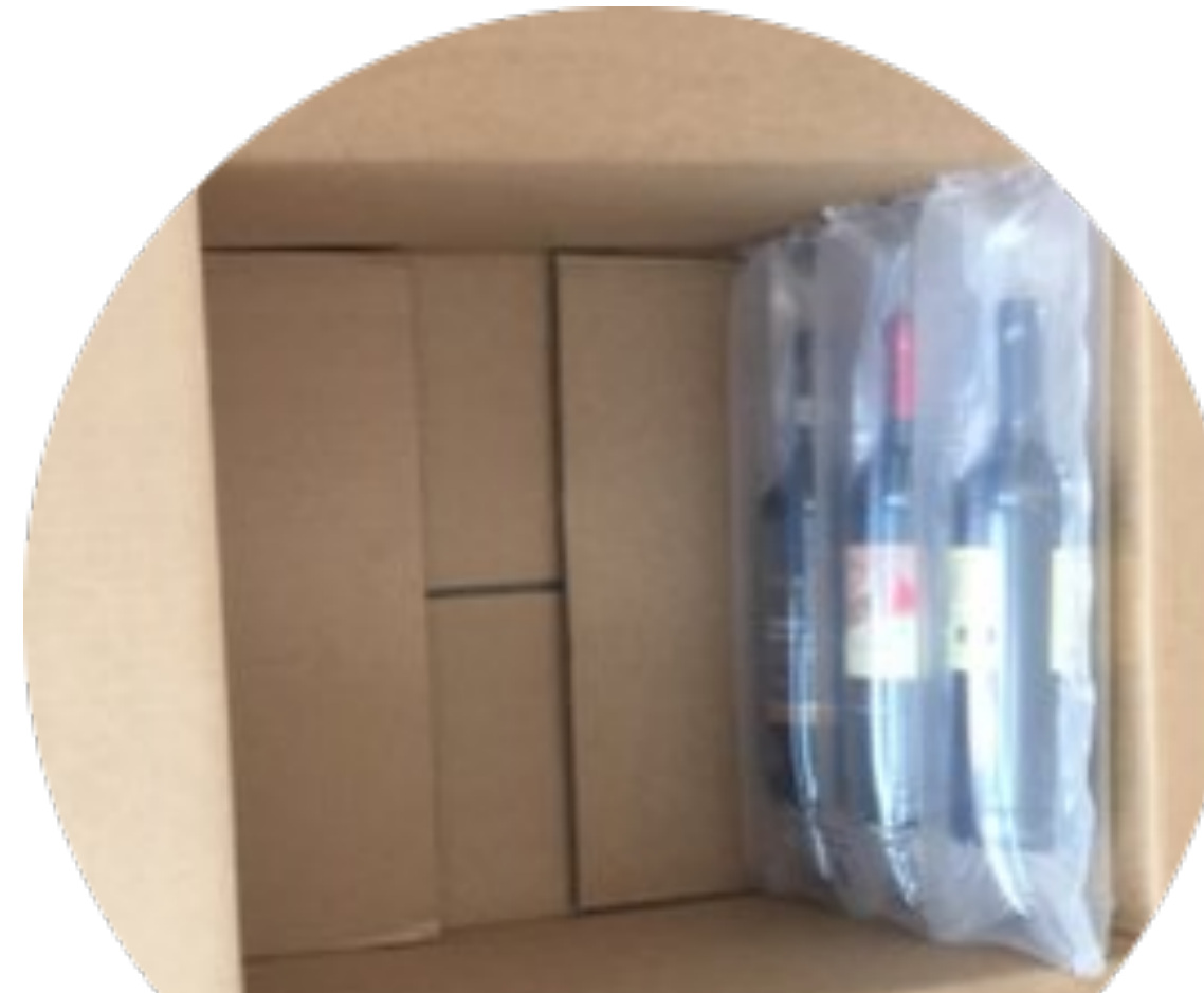
Imballaggio interno con pellicola protettiva con scatola esterna in cartone ondulato